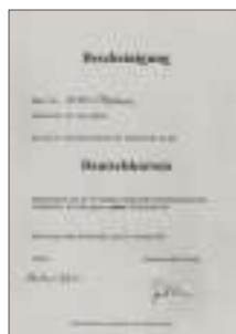
ATTESTATO OTJ CONSEGUITO IN ITALIA

Passato l'esame finale i candidati avranno accesso allo step successivo che prevede la partenza per la Germania, dove verranno avviati ad un secondo corso intensivo.