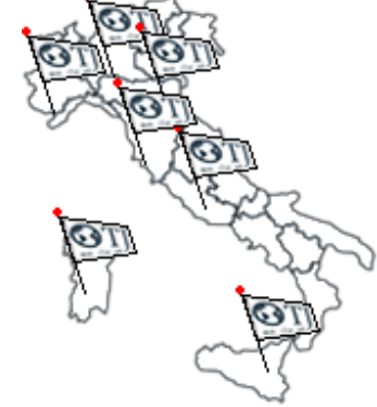
LE NOSTRE SEDI OPERATIVE IN ITALIA