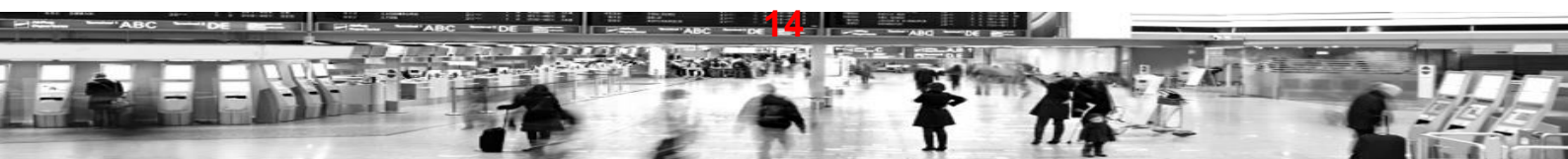
Esempio di "Slide" piattaforma e Learning – corso per videoterminalisti OTJ